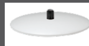
Bezogener Teller (Leder oder Stoff)