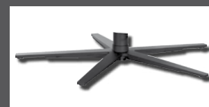
Metall-Sternfuß verchromt Edelstahl optik oder pulverbeschichtet anthrazit