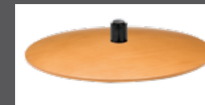
Holzsteller in mehreren Farben