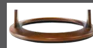
Holzdrehring in mehreren Farben